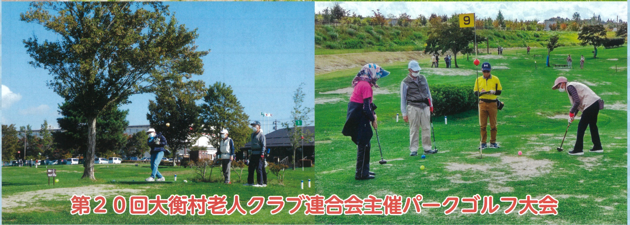
第20回大衡村老人クラブ連合会主催パークゴルフ大会