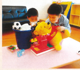
お買い物ごっこ楽しいね