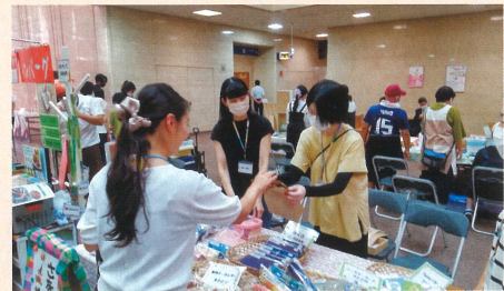
ふれあいフェスティバル (県庁にて)

9月14日(木)、県庁ロビーで行われた「ふれあいフェスティバル」に出展し、さをり織り製品の販売を行ってきました。 利用者さんが、準備や販売を経験され、自分の製品をお客様が購入してくださり、自信に繋がる良い機会でした。