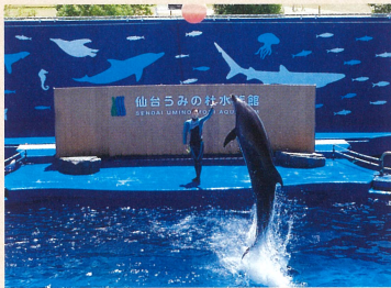
イルカジャンプに感激

宿題を二人で協力し合い頑張っている子どもたち。 いつも相手を気遣いながら、兄弟のように仲良く活動しています。 夏休みの遠足は、仙台うみの杜水族館へ行き、愛らしいイルカ や魚を見て、海の世界を楽しんできました。 水族館でのお土産は、悩みながらも欲しいものを選び、大満足 の遠足でした。