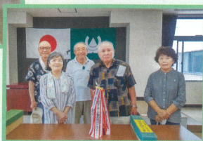
見事優勝した衡下Bチームの皆さん